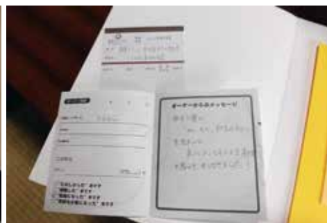
本に寄せる推薦文