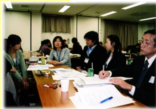
研究所報告・交流集会