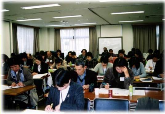
市民向けの研修会