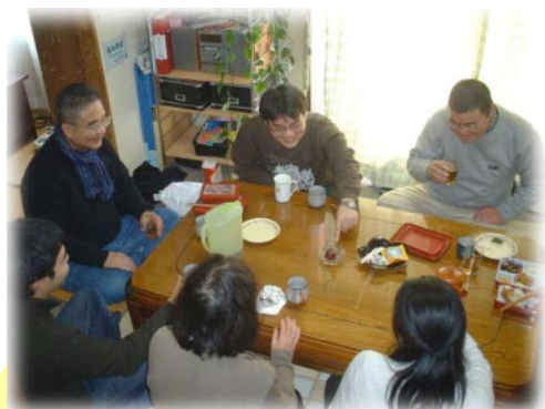
地域の中の安心の場

暮らしを支える多様な仕組みづくり 長期社会的入院者の退院支援 一人暮らしの準備に関する相談・支援 就労相談・支援及び働く場の創出 グループ活動 地域の関係諸機関・団体との連携