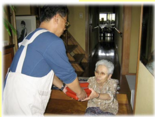
いきがいを持って働く