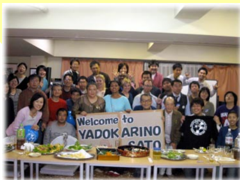
日米精神障害当事者交流プロジェクト

会員交流活動 家族会活動 日米精神障害当事者交流会の開催 バザー等の開催と委員会活動 全国、県・市内外の関係機関との連携 国内外の障害者団体との連携