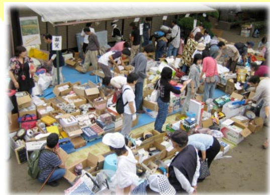
毎年開催する大バザーは地域交流の場